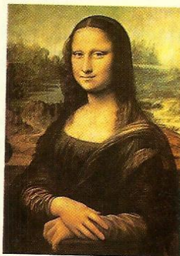
Da Vinci, Leonardo. La Gioconda o Mona Lisa.

□ Recién en 1913, Perugia fue detenido al intentar vender la auténtica Mona Lisa al director del museo italiano Galleria degli Uffizi. El romántico carpintero sostuvo en el momento de la captura que su única intención al sustraerla había sido rescatarla de manos de los franceses y regresar la obra al país que pertenecía: Italia.